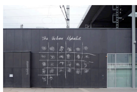
Städtische Kartographien als