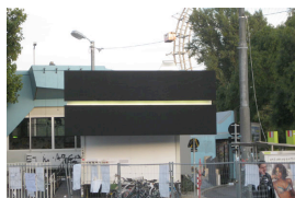
Reduktionistische Medienfassade und Projektionsfläche für Wunschvorstellungen: 1:2,35 (2009) von Sonja Gangl .